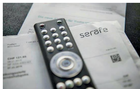
La redevance à la SSR devrait prochainement diminuer. Le montant de la baisse dépendra des événements à venir.

Le Conseil demande de poser et chiffrer des mesures et des objectifs en matière de couverture des régions. «Ce n'est que sur cette base qu'il sera possible ensuite de déterminer les besoins financiers et les mon-